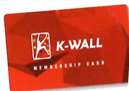
K-WALLフリーパス会員専用の ICカード会員証